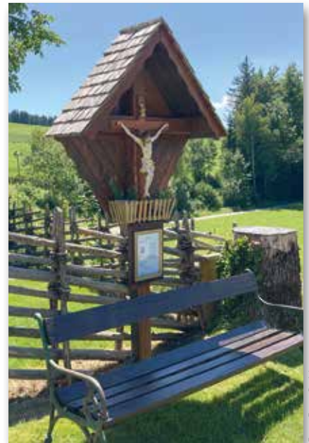
Wegkreuz in Hohenau